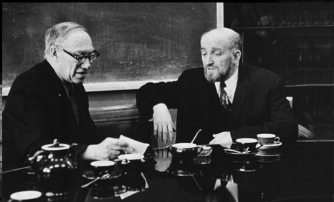
Академик М.А. Лаврентьев с академиком Г.И. Буджером. 1973 г.