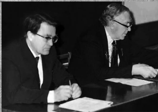
Сакадемиком А. Л.Яншиным . Москва, 1985 г.