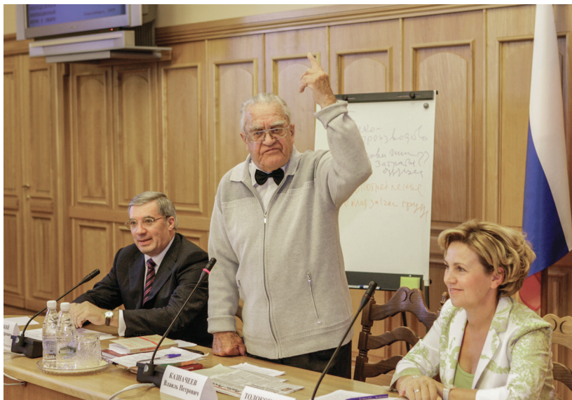
I Международный молодежный инновационный форум «Интерна-2009»

и предусмотрительно придать ему статус общественной организации. Графический символ этого института не случайно совпал с символом жизни в виде здорового дерева, крепкого дубового листа, растущего из открытой книги знаний.