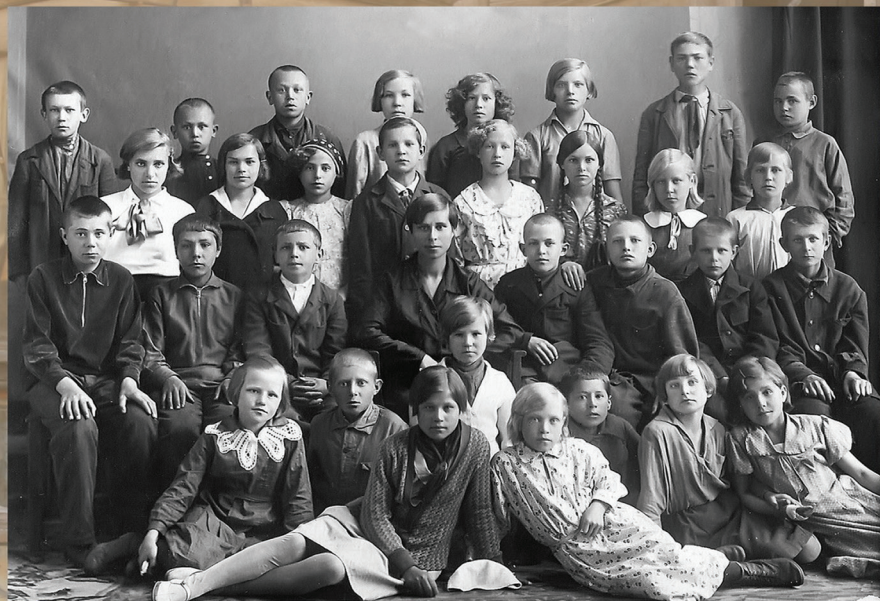
Школьный класс. Томск, 1935 г.