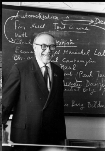
Академик Лаврентьев Михаил Алексеевич